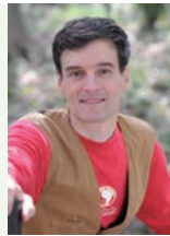
アーサー・ピナード (詩人)

1994年TBS入社。「筑紫哲也News23」「ニュースの森」などを担当する。2001年3月TBS退社。1年弱のニューヨーク滞在を経てフリーとなる。その後、司会、執筆、朗読の他、各界のトップランナー数百人に取材するなどインタビューアとして活躍。10年3月慶應義塾大学大学院メディアデザイン研究科・修士課程修了。15年3月「山根基世の朗読指導者養成講座」(主催:文字・活字文化推進機構)第一期修了。以降、同講座でアシスタント講師を務める。16年オーチャードホールにて「映像の世紀コンサート」ナレーションを担当。18年サントリーホールで朗読コンサートを初プロデュースする。