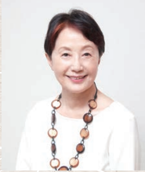
元NHKアナウンサー 山根基世 (朗読)