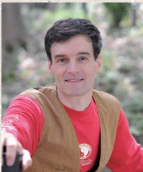
詩人 アーサー・ビナード (朗読) 「釣り上げては」他 アーサー・ビナード (思潮社)