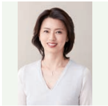
進藤晶子 (元TBSアナウンサー)

1948年、山口県生まれ。71年、早稲田大学文学部卒。同年、NHK入局。報道、美術、旅番組など多数の番組、NHKスペシャル「人体」「映像の世紀」等、大型シリーズのナレーションを担当。2005年、女性として初のアナウンス室長。07年、NHK退職。00年、放送文化基金賞受賞。15年度より、公益社団法人文字・活字文化推進機構にて「山根基世の朗読指導者養成講座」開講。「山根基世の朗読読本」「こころの声を「聴く力」」他、著書多数。FM TOKYO「感じて、漢字の世界」毎週土曜日JFN全国38局ネットで放送中。TBS日曜劇場「半沢直樹」ナレーション担当。