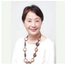
山根基世 (元NHKアナウンサー)

1948年、山口県生まれ。71年、早稲田大学文学部卒。同年、NHK入局。報道、美術、旅番組など多数の番組、NHKスペシャル「人体」「映像の世紀」等、大型シリーズのナレーションを担当。2005年、女性として初のアナウンス室長。07年、NHK退職。00年、放送文化基金賞受賞。15年度より、公益社団法人文字・活字文化推進機構にて「山根基世の朗読指導者養成講座」開講。「山根基世の朗読読本」「こころの声を「聴く力」」他、著書多数。FM TOKYO「感じて、漢字の世界」毎週土曜日JFN全国38局ネットで放送中。TBS日曜劇場「半沢直樹」ナレーション担当。