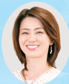
司会・朗読 進藤 晶子さん