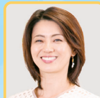
進藤 晶子 さん

1971年生まれ、大阪府出身。神戸松蔭女子学院大卒業後、94年、TBSにアナウンサーとして入社。「NEWS23」のキャスターを務める。99年10月から「ニュースの森」のメインキャスターとして活躍。2001年、TBSを退社しアナウンサーを経て独立。朗読、エッセーの執筆の他、各界の著名人数百人を取材するなどインタビューとしても活躍する。慶応義塾大学大学院で「在宅介護」をテーマに研究し、修士課程修了。現在、TBSテレビ「がっちりマンデー!!」、BS朝日「熱中世代大人のランキング」などで司会を務める。