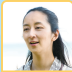
音楽 さいいれいしうさん

1971年生まれ、大阪府出身。神戸松蔭女子学院大卒業後、94年、TBSにアナウンサーとして入社。「NEWS23」のキャスターを務める。99年10月から「ニュースの森」のメインキャスターとして活躍。2001年、TBSを退社しアナウンサーを経て独立。朗読、エッセーの執筆の他、各界の著名人数百人を取材するなどインタビューとしても活躍する。慶応義塾大学大学院で「在宅介護」をテーマに研究し、修士課程修了。現在、TBSテレビ「がっちりマンデー!!」、BS朝日「熱中世代大人のランキング」などで司会を務める。