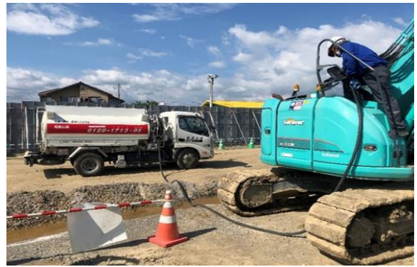
『GTL燃料』の給油作業の様子