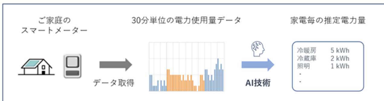
スマートメーターから得られる 30 分単位の電力使用量データをもとにした家電分離推定のイメージ

伊藤忠エネクスグループは、今後もエネルギーマネジメントに係る次世代ビジネスの可能性を追求するとともに、エネルギーを通じて、脱炭素社会の実現と、お客様や社会の幅広い課題の解決に貢献してまいります。