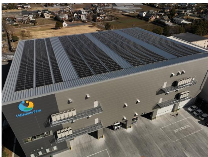
①アイミッションズパーク加須太陽光発電所