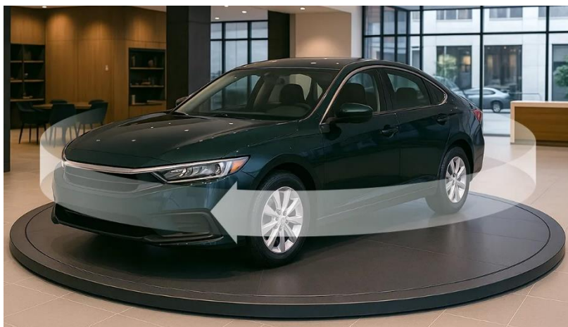
「360°Car®」により360°全方位の車両画像撮影が可能

今後は、中古車の販売・買取、オートオークション(AA)、CS(カーライフステーション) ※1 ネットワークでの活用など、当社モビリティ事業における幅広い領域で連携が可能と見込んでおり、AGENCIA と具体的な協業の検討を進めてまいります。