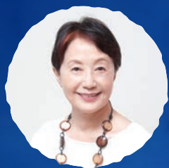
元NHKアナウンサー 山根基世 (朗読)