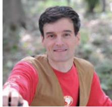
アーサー・ピナード (詩人)

1948年、山口県生まれ。71年、早稲田大学文学部卒。同年、NHK入局。報道、美術、旅番組など多数の番組、NHKスペシャル「人体」「映像の世紀」等、大型シリーズのナレーションを担当。2005年、女性として初のアナウンス室長。07年、NHK退職。00年、放送文化基金賞受賞。15年度より、公益社団法人文字・活字文化推進機構にて「山根基世の朗読指導者養成講座」開講。「山根基世の朗読読本」「この声の「聴く力」」他、著書多数。FM TOKYO「感じて、漢字の世界」毎週土曜日JFN全国38局ネットで放送中。TBS日曜劇場「半沢直樹」ナレーション担当。