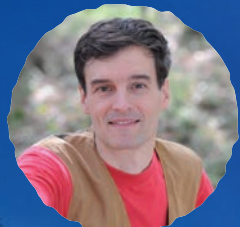
詩人 アーサー・ピナード (朗読)