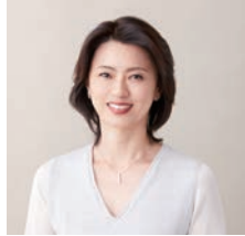
進藤晶子 (元TBSアナウンサー)

1967年、アメリカ・ミシガン州生まれ。ニューヨーク州のコーネル大学で英文学を学び、卒業と同時に来日、日本語での詩作を始める。第一詩集『釣り上げては』で中原中也賞、『日本語ばかりごり』で講談社エッセイ賞、『ここが家だ——ベン・チャーの第五福竜丸』で日本絵本賞、『左右の安全』で山本健吉文学賞、『さがしています』で講談社出版文化賞絵本賞を受賞。また、2017年には早稲田大学坪内逍遙大賞奨励賞を受賞。エッセイ集に「アーサーの言の葉食堂」、絵本に「ドームがたり」、翻訳絵本に「なすずこのつべ?」ほか多数。文化放送「アーサー・ピナード 午後の三枚おろし」にも出演。