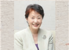
山根基世 (元NHKアナウンサー)

札幌市中央区北4条西6丁目3-3 六花亭札幌本店6階 事前申込み制(定員218名 入場無料先着順)