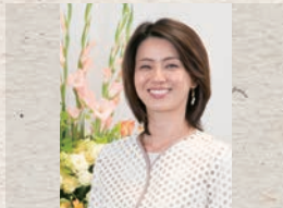
進藤晶子 (元TBSアナウンサー)

1948年、山口県生まれ。71年、早稲田大学文学部卒。同年、NHK入局。報道、美術、旅番組など多数の番組、NHKスペシャル「人体」「映像の世紀」等、大型シリーズのナレーションを担当。2005年、女性として初のアナウンス室長。07年、NHK退職。00年、放送文化基金賞受賞。16年度より、公益社団法人文字・活字文化推進機構にて「山根基世の朗読指導者養成講座」開講。「山根基世の朗読読本」「こころの声を「聴く力」」他、著書多数。FM TOKYO「感じて、漢字の世界」毎週土曜日JFN全国38局ネットで放送中。TBS日曜劇場「半沢直樹」ナレーション担当。