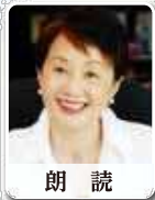
朗読 山根 基世さん

1948年、山口県生まれ。1971年、早稲田大学文学部卒。同年、NHK入局。主婦や働く女性を対象とした番組、美術番組、旅番組、ニュース、「ラジオ深夜便」、NHKスペシャル「人体」「映像の世紀」等、大型シリーズのナレーション多数を担当。2005年、女性として初のアナウンス室長。2007年、NHK退職。2000年「放送文化基金賞」、2009年「徳川夢声市民賞受賞」。東京大学客員准教授、女子美術大学講師等歴任。「ことばで「私」を育てる」他、著書多数。FM TOKYO「感じて、漢字の世界」毎週土曜日JFN全国38局ネットで放送中。TBS 日曜劇場「半沢直樹」ナレーション担当。