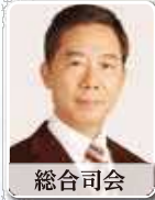
総合司会 町永 俊雄さん

1948年、山口県生まれ。1971年、早稲田大学文学部卒。同年、NHK入局。主婦や働く女性を対象とした番組、美術番組、旅番組、ニュース、「ラジオ深夜便」、NHKスペシャル「人体」「映像の世紀」等、大型シリーズのナレーション多数を担当。2005年、女性として初のアナウンス室長。2007年、NHK退職。2000年「放送文化基金賞」、2009年「徳川夢声市民賞受賞」。東京大学客員准教授、女子美術大学講師等歴任。「ことばで「私」を育てる」他、著書多数。FM TOKYO「感じて、漢字の世界」毎週土曜日JFN全国38局ネットで放送中。TBS 日曜劇場「半沢直樹」ナレーション担当。