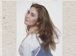
酒井美直 (歌手・舞踏家)

1971年生まれ、大阪府出身。神戸松蔭女子学院大学卒業後、94年、TBSにアナウンサーとして入社。「NEWS23」のキャスターを務める。99年10月から「ニュースの森」のメインキャスターとして活躍。2001年、TBSを退社しアナウンサーを経て独立。朗読、エッセイの執筆の他、各界の著名人数百人を取材するなどインタビュアーとしても活躍する。慶應義塾大学大学院で「在宅介護」をテーマに研究し、修士課程修了。現在、TBSテレビ「がっちりマンデー!!」で司会を務める。