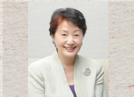
山根基世 (元NHKアナウンサー)

札幌市中央区北4条西6丁目3-3 六花亭札幌本店6階 事前申込み制(定員218名 入場無料先着順)