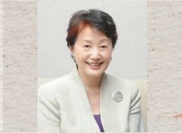
山根基世 (元NHKアナウンサー)

札幌市中央区北4条西6丁目3-3 六花亭札幌本店6階 事前申込み制(定員218名 入場無料先着順)