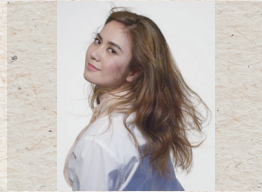
酒井美直 (歌手・舞踏家)

1971年生まれ、大阪府出身。神戸松蔭女子学院大学卒業後、94年、TBSにアナウンサーとして入社。「NEWS23」のキャスターを務める。99年10月から「ニュースの森」のメインキャスターとして活躍。2001年、TBSを退社しアナウンサーを経て独立。朗読、エッセイの執筆の他、各界の著名人数百人を取材するなどインタビュアーとしても活躍する。慶應義塾大学大学院で「在宅介護」をテーマに研究し、修士課程修了。現在、TBSテレビ「がっちりマンデー!!」で司会を務める。