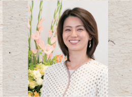
進藤晶子 (元TBSアナウンサー)

1948年、山口県生まれ。71年、早稲田大学文学部卒。同年、NHK入局。報道、美術、旅番組など多数の番組、NHKスペシャル「人体」「映像の世紀」等、大型シリーズのナレーションを担当。2005年、女性として初のアナウンス室長。07年、NHK退職。09年、放送文化基金賞受賞。16年度より、公益社団法人文字・活字文化推進機構にて「山根基世の朗読指導者養成講座」開講。「山根基世の朗読読本」「こころの声を「聴く力」」他、著書多数。FM TOKYO「感じて、漢字の世界」毎週土曜日JFN全国38局ネットで放送中。TBS日曜劇場「半沢直樹」ナレーション担当。